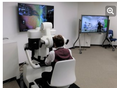
写真1 愛知にある手術支援ロボット「hinotori」を東京から遠隔操作する様子 右の画面は藤田医科大学本院のhinotoriと操作する医師の様子（中継）。左の画面には術野のリアルタイム映像が映し出されている。東京の会場に設置されたサージョンコックピット（操作卓）を熟練医が操作し、一部の手技を交代しながら遠隔での指導を行った。

今回、シスメックスの東京遠隔ロボット実験施設（東京都港区）と、約250km離れた藤田医科大学のMIL-Nagoyaを専用回線で結び、遠隔手術支援の実証実験を行った。MIL-