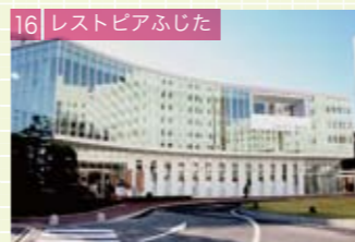
16 レストピアふじた