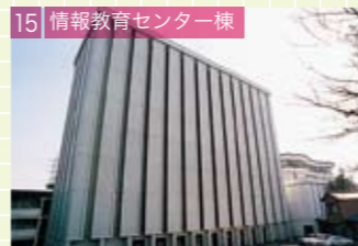
15 情報教育センター棟