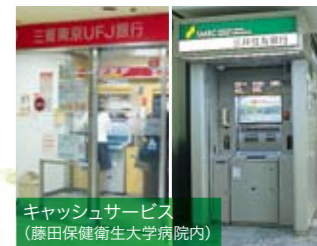
キャッシュサービス (藤田保健衛生大学病院内)

◎三井住友銀行 ATM(病院内1F) ◎三菱東京UFJ銀行ATM(病院内2F) 平日/9:00~18:00 土曜日/9:00~17:00