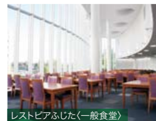
レストピアふじた(一般食堂)

麺類・カレー・丼物・ランチ・一品料理など。人気No.1メニューは具だくさんの豚汁定食です！大きな窓から光が差し込む広い食堂内は明るく、開放感でいっぱいです。