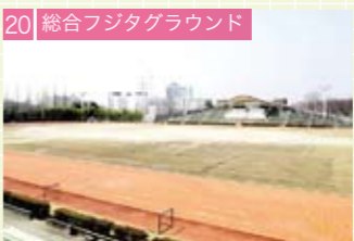
20 総合フジタグラウンド