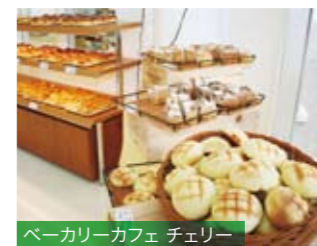
ベーカリーカフェ チェリー

麺類・カレー・丼物・ランチ・一品料理など。人気No.1メニューは具だくさんの豚汁定食です！大きな窓から光が差し込む広い食堂内は明るく、開放感でいっぱいです。