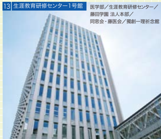
13 生涯教育研修センター1号館 医学部/生涯教育研修センター/ 藤田学園 法人本部/ 同窓会・藤医会/獨創一理祈念館