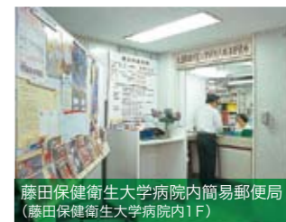
藤田保健衛生大学病院内簡易郵便局 (藤田保健衛生大学病院内1F)