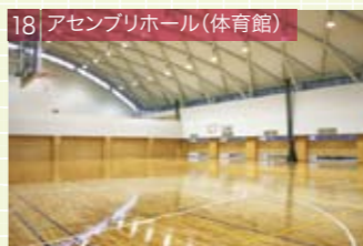
18 アセンブリホール(体育館)