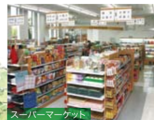
スーパーマーケット

ボリューム・品揃え・お値段は学生向け。食べ過ぎて、午後の講義が夢ごちにならないように!!