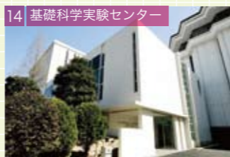
14 基礎科学実験センター