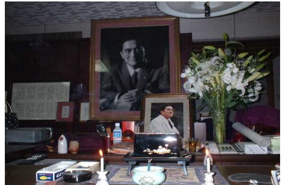
故・藤田啓介総長先生遺影