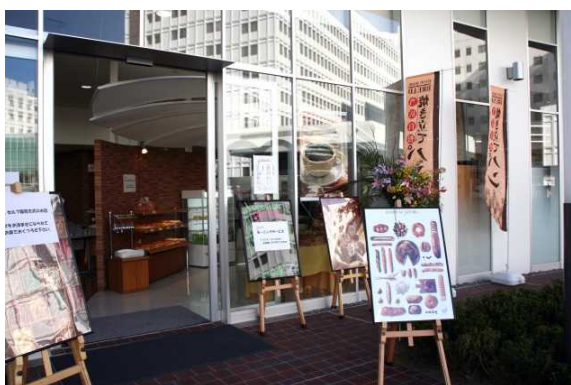
ベーカリー&カフェ「チェリー」(外観)