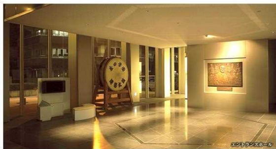
独創一理記念館エントランス