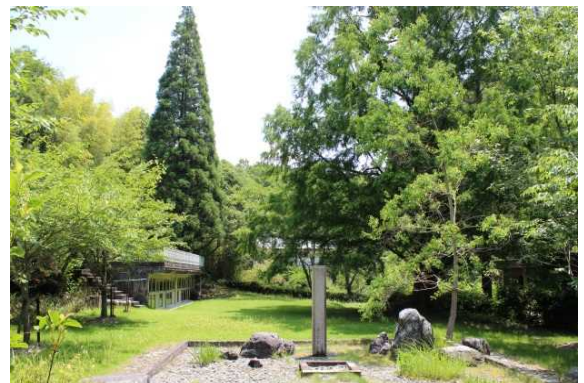
湯元七栗の湯壺号泉とあけぼのの杉