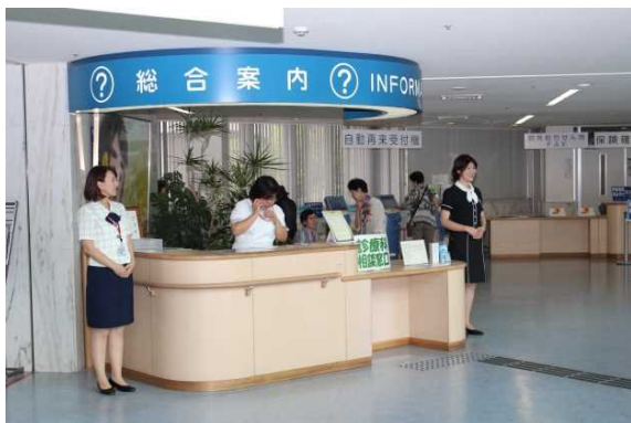
大学病院総合受付