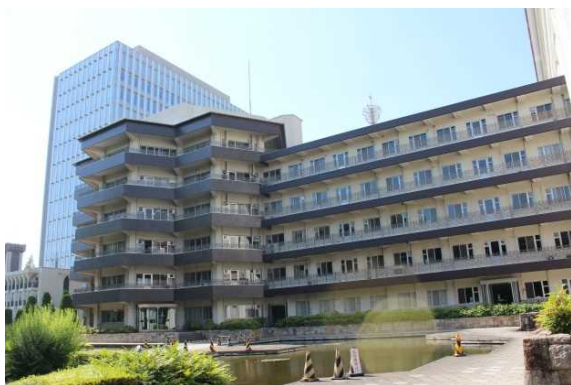
総合医科学研究所・看護専門学校