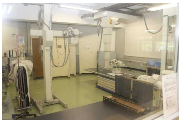
5号館一般撮影実習室