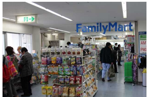
大学病院内ファミリーマート(2F)

「大学病院外来棟」です。 平均2000人/日の外来患者様の診察を行っています。 1F総合案内ではアテンダントが患者様をエスコートしています。 2Fにはドールコーヒー、ファミリーマートがあり、多くの方に利用されています。