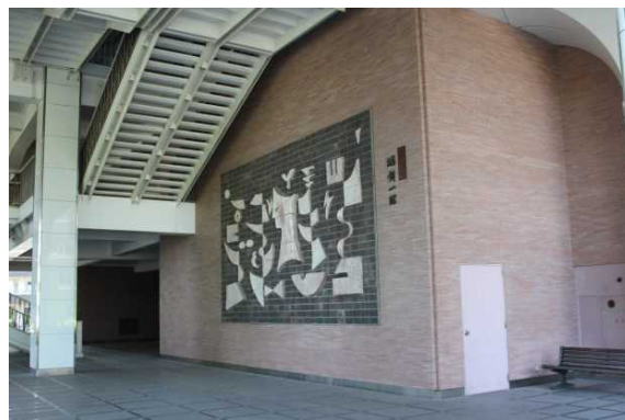
陶壁「建学の理念: 獨創一理」