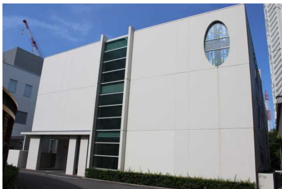
基礎科学実験センター(外観)