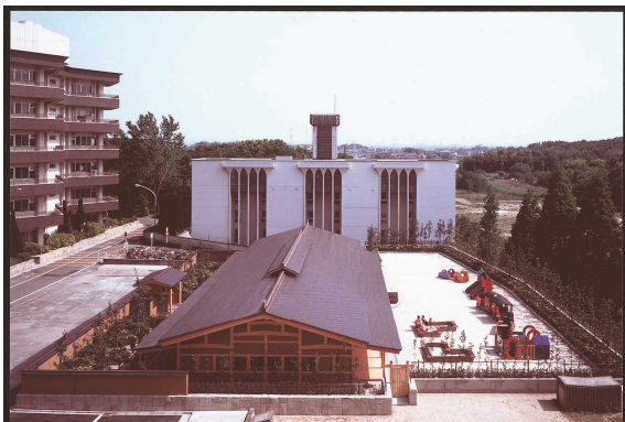
旧ハニサクル保育園