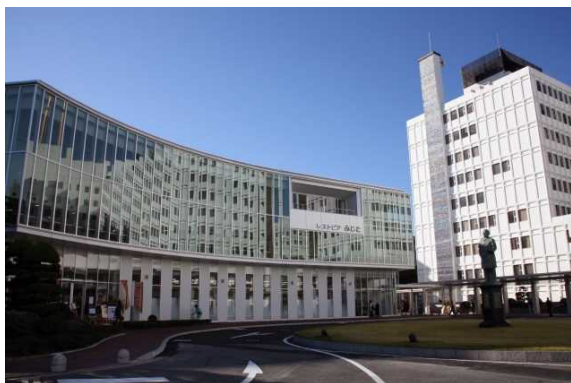
レストピアふじた(外観)