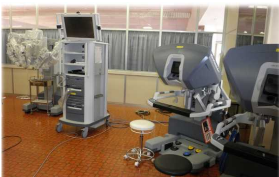
ダヴィンチ低侵襲トレーニングセンター