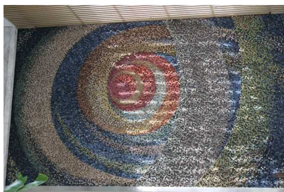
太陽のプロミネンス