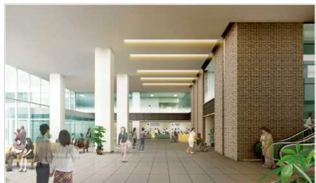
大学病院新病棟(完成予想図)