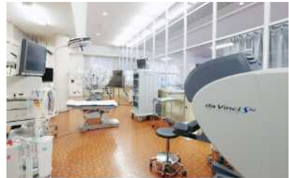
ダヴィンチ低侵襲トレーニングセンター

続いて「生涯教育研修センター1号館」です。 現在、医学部の講義室だけでなく学園本部があり、学園の中核として機能している場所です。また、旧忍冬塾Fにあるダヴィンチトレーニングセンターは全国から研修希望者が殺到している場所です。