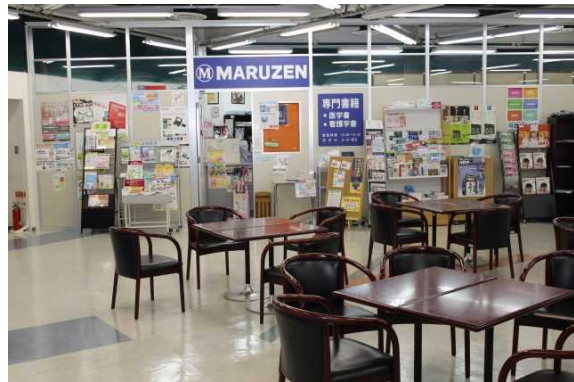
チャペル内観と丸善書店