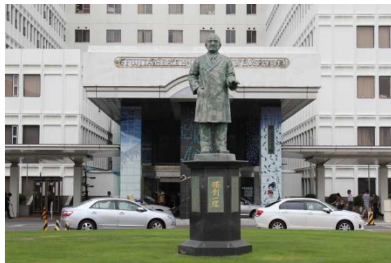
藤田啓介総長先生銅像