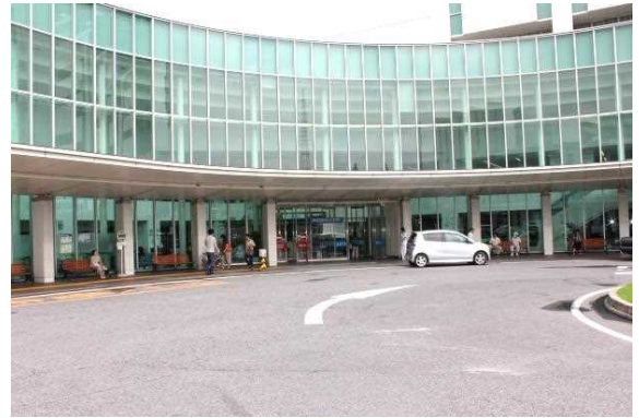
大学病院正面玄関