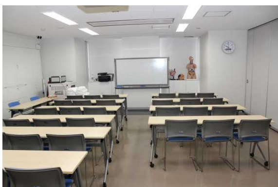
臨床生理検査学講義室