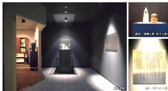
前室(我慢人形・祈り人形)