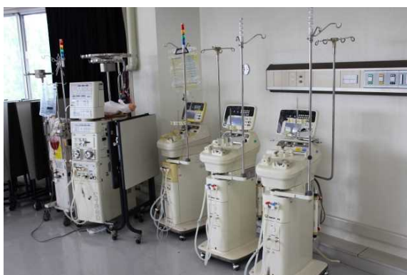
8号館実習室(代謝機能代行技術学)