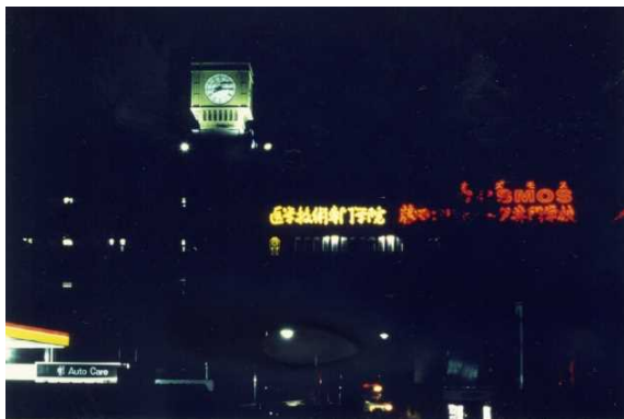
医学技術専門学院とカズモス

旧桶狭間キャンパスです。 桶狭間キャンパスは、学園本部の移 転に伴い、売却されましたが、建物 外観はそのままに保存・使用されて います。