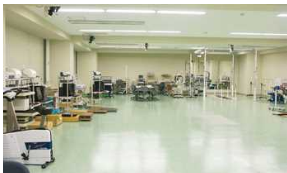
7号館(運動評価学研究室)