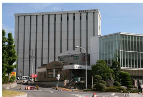
情報教育センター棟