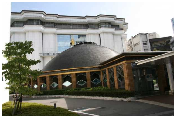
北方向からの景観