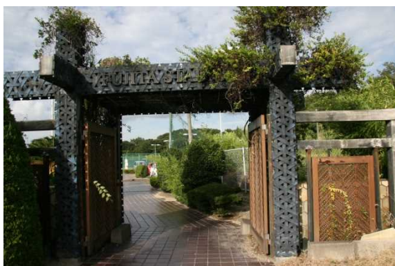
多目的グラウンドゲート