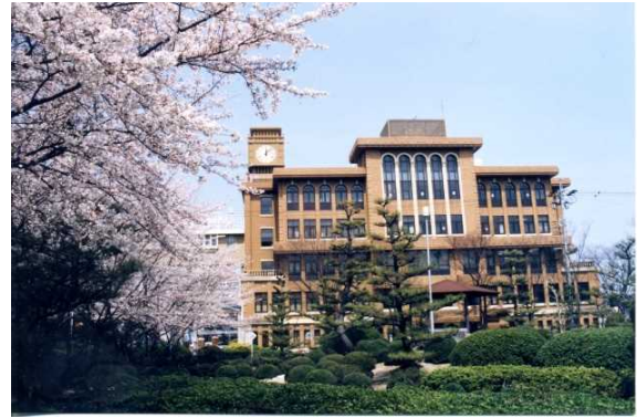
旧学園本部と看学・専学・カズモス