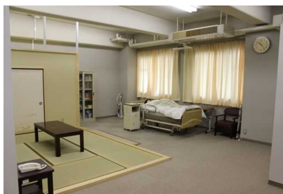
看護専門学校(在宅看護実習室)