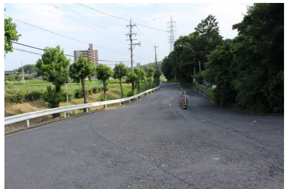
山門から八幡社への道

続いて「通用門(通称:山門)」です。 50年前と姿は変わりましたが、学園 開設時(昭和41年)から変わらぬ場 所に立ち、登下校の学生を見守って います。