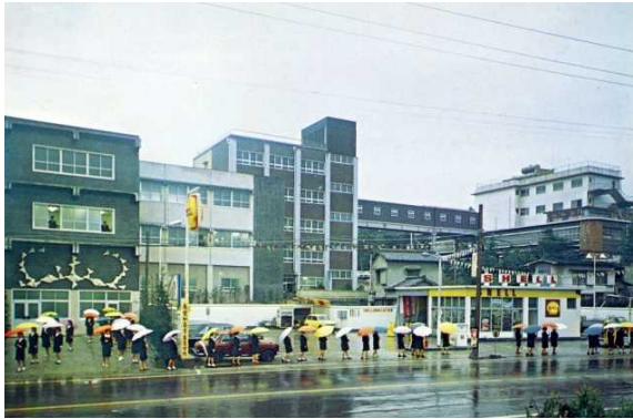
桶狭間キャンパス学生通学風景