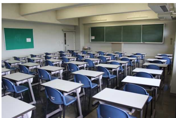
看護専門学校(講義室)