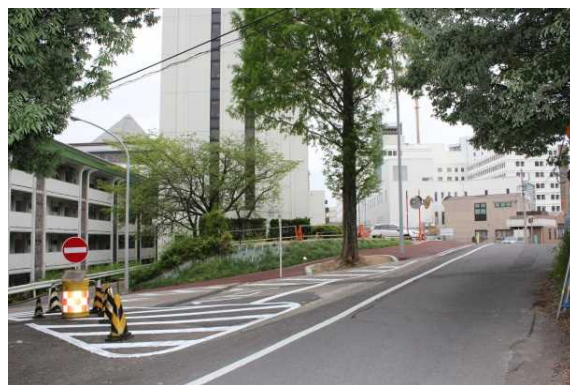
旧鎌倉街道より病院を臨む

続いて「医療科学部7号館」です。こちらはリハビリテーション学科の講義・実習室があります。 また、旧鎌倉街道へと続く坂道の横には職員宿舎「とよあけ」があります。現在は約半数の部屋が医学部生の自習室として利用されています。