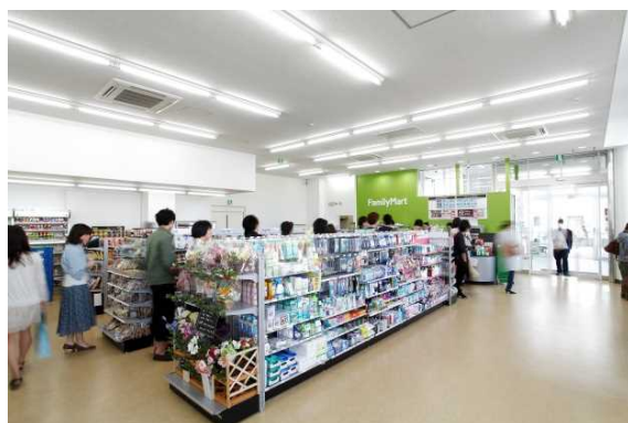
ファミリーマート(店内)

次は「レストピアふじた」です。 2Fはガラス張りの壁面で開放感が自慢の食堂です。 1Fはコンビニエンス・ストア(ファミリーマート)とベーカリーショップ「チェリー」があり、毎日多くの利用者で賑わっております。