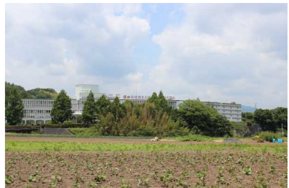
七栗サナトリウム