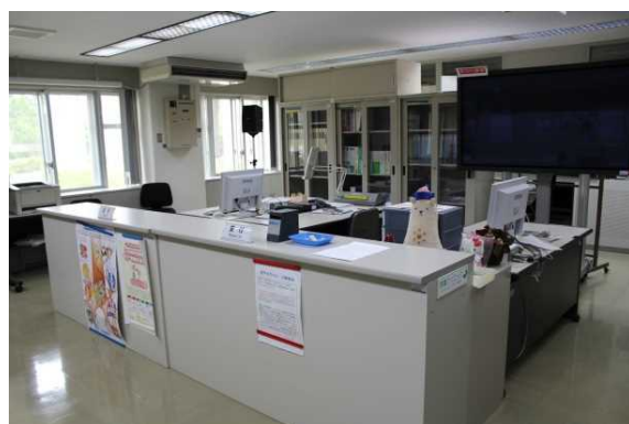
9号館実習室(模擬病院「わかばクリニック」)