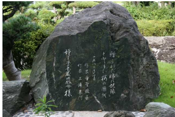
「贈られた眼の記録」碑