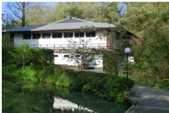
旧藤田記念七栗研究所