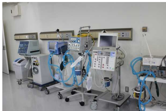
8号館実習室(循環機能代行技術学)