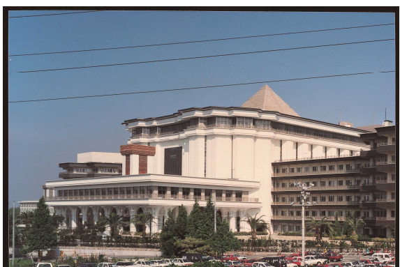
フジタホール2000 全景