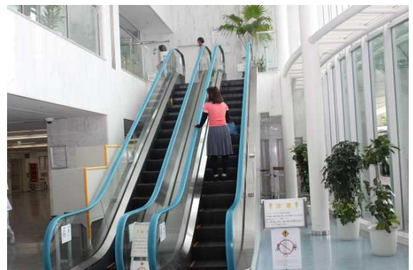
大学病院エスカレーター