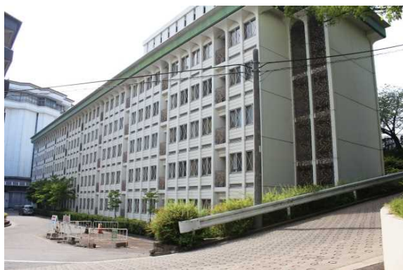
職員宿舎「とよあけ」