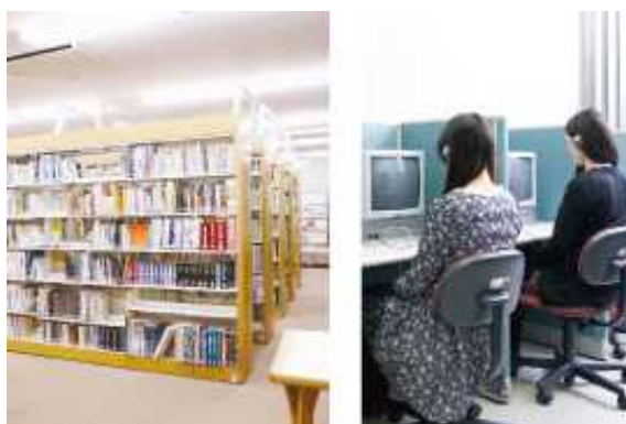
看護専門学校(図書室)

次は「総合医科学研究所」と「看護専門学校」です。 総医研の5研究部門では、世界をリードする幅広い総合的研究がおこなわれています。 また、看護専門学校では、患者さんの痛みや苦しみを理解できる真の看護師を目指し、多くの学生が学んでいます。