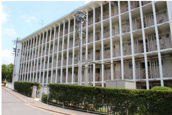
新藤田記念七栗研究所