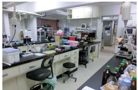
新藤田記念七栗研究所研究室