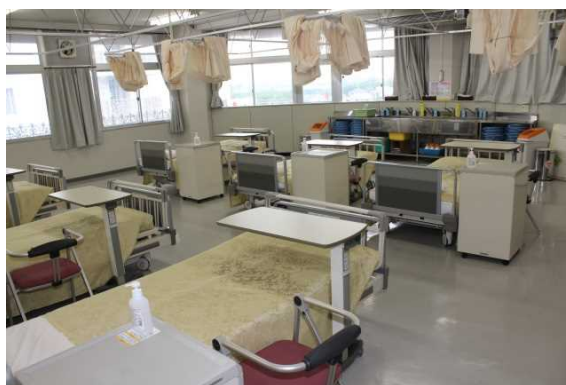
6号館成人看護実習室

続いて「医療科学部5、6号館」です。 5号館は放射線学科の講義、実習室があります。耐震補強工事が完成しました。 6号館は看護学科の講義、実習室と1階には事務部があります。看護学科は医療科学部3号館でも実習を行っています。