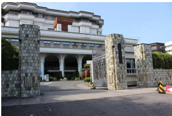
山門からフジタホールを臨む