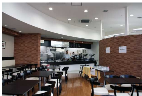
ベーカリー&カフェ「チェリー」(店内)