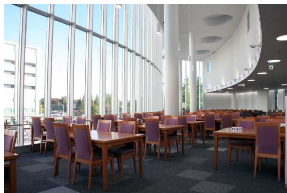
レストピアふじた(内観)