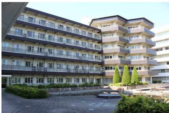
医療科学部8・9号館