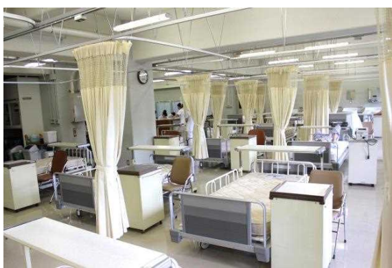
看護専門学校(看護実習室)