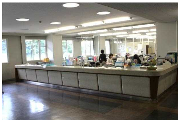
看護専門学校(教務室)