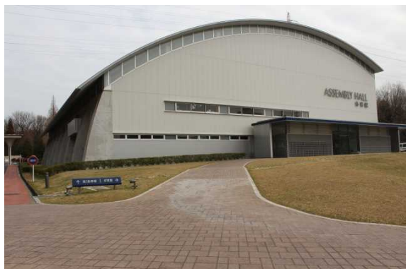
アセンブリホール(外観)