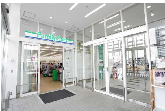
ファミリーマート(出入口)