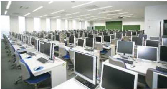
生涯教育研修センター1号棟(IT学習室)