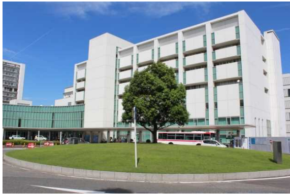
大学病院外来棟(全景)