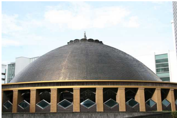
プレアデスチャペル