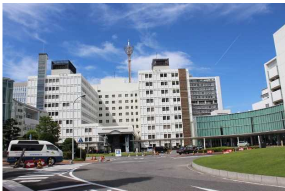
藤田保健衛生大学病院(全景)