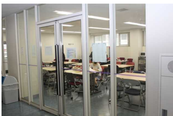
基礎科学実験センター学生ホール