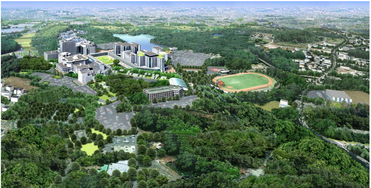
20年後の藤田学園全景予想図