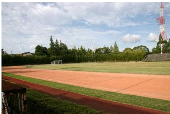
トラック&フィールド