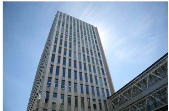
生涯教育研修センター1号棟