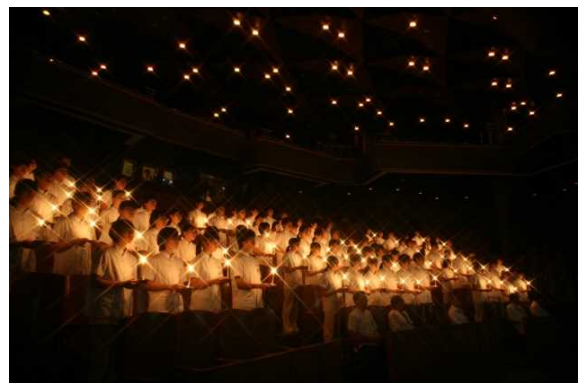
ホスピタルトレーニング宣誓式

そろそろ散策も終点に近づいてまいりました。ビラコスモスのアーチをくぐると、新立体駐車場が見えてきました。その隣には病院の3号棟、そして、医学部1号館です。図書館は常時多くの学生に利用されています。500人ホールでの戴帽式、ホスピタルトレーニングに懐かしい思い出をお持ちの方も多いのではないのでしょうか。