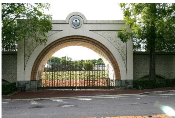
総合フジタグラウンド(メインゲート)