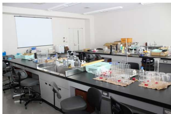
公衆衛生学実習室