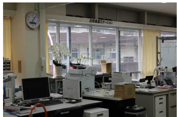
地域包括ケア中核センター

続いて旧アセンブリホール跡地に建設された低侵襲画像診断・治療センターです。2012年9月に竣工され、最新鋭のCT、MRI等の機器を完備した、超低侵襲の診断・治療を行える中枢的な施設です。その隣には地域医療・介護における人材の教育等を目指す、地域包括ケア中核センターが2013年2月に開設されました。