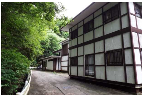
旧藤田記念七栗研究所学生寮