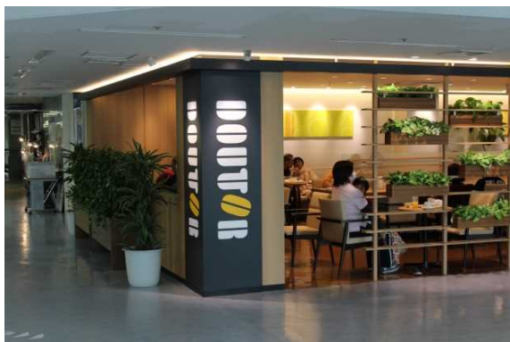
大学病院内ドールコーヒー(2F)