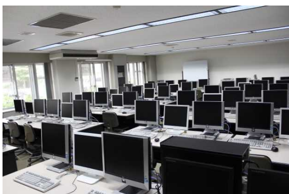
9号館実習室(医療情報処理学実習室)