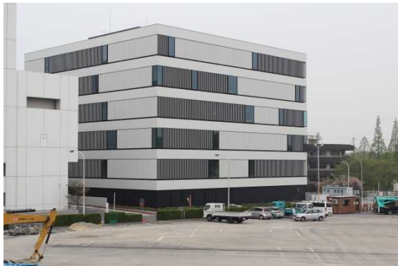
低侵襲画像診断・治療センター(外観)