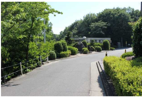
北東から山門守衛室を臨む