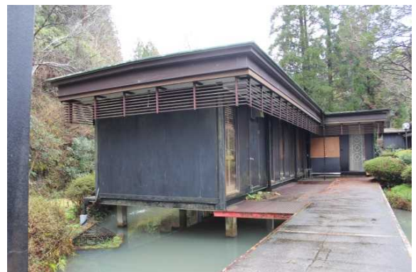
学生食堂 水の上一心亭