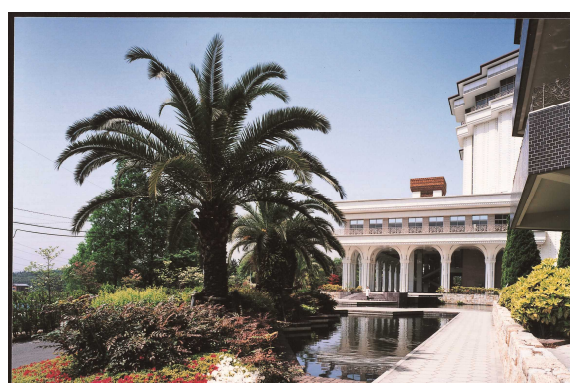
東方向からの景観