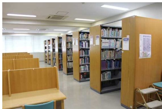
リハビリテーション学科内図書館分室