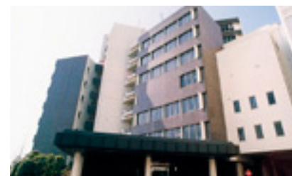
2 医学部1号館 ビジュアルセンター／フジタホール500／図書館／学生相談室