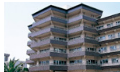
3 医学部3号館 総合医科学研究所