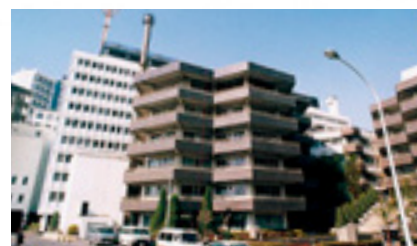
6 医療科学部1号館 キャリア支援課