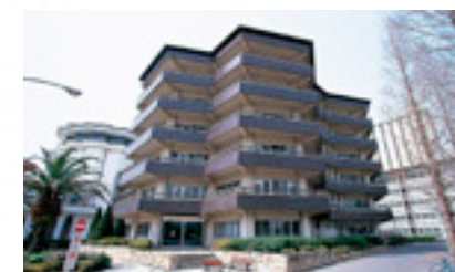
5 短期大学・医療科学部8号館