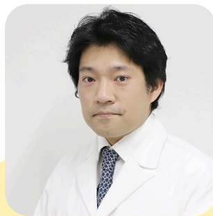
【インタビュアー】 桑原和伸

名古屋で活躍する 研究者から話を伺う FMラジオ番組内で 私が両立支援について インタビューします