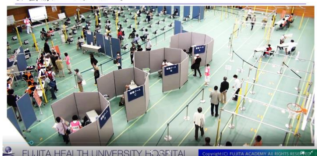
1. 会場ブースについて

受付から接種後観察まで、会場のレイアウトに沿って配慮しておきたい事項や注意点を動画と文字と音声で解説しています。