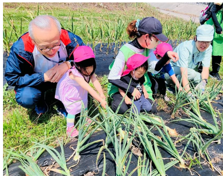
キッズコスモス園児、スマイルチームスタッフ、教職員が協力して玉ねぎの収穫