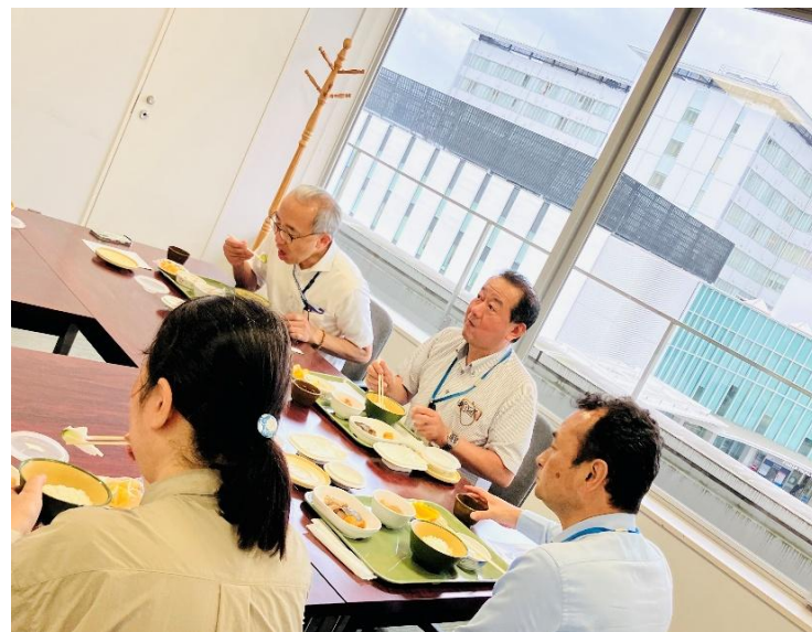
今回は、東海農政局の秋葉一彦局長に試食いただきました。