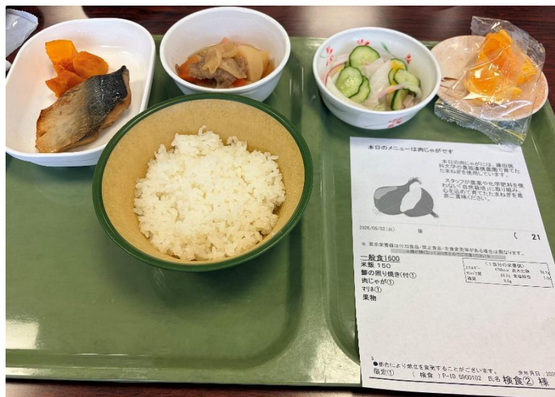
肉じゃがとして調理されました（中央ご飯の上）。

今回の収穫は、学園内保育所キッズコスモスの皆さんが手伝ってくれて、肉じゃがに加工され、患者の皆さんに提供されました。