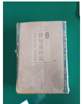
俳句で使用する辞書