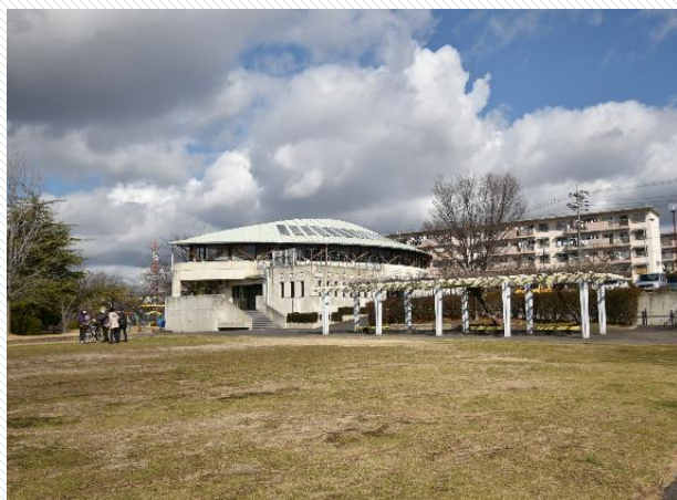
唐竹公園&自治センター