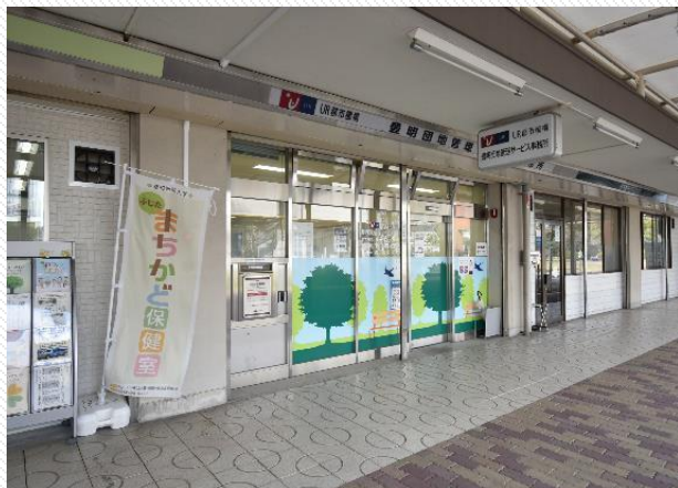
管理サービス事務所