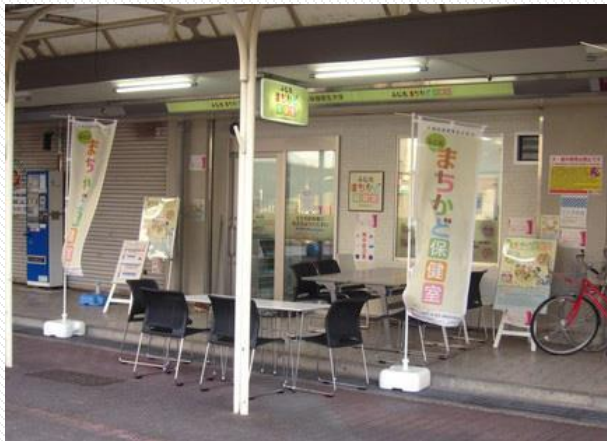
ふじたまちかど保健室